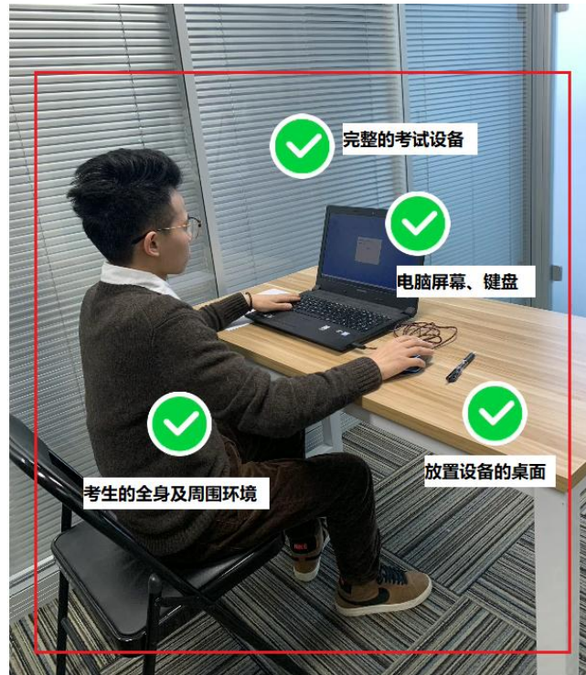
图四：佐证视频监控视角

(5) 电脑端和移动端摄像头全程开启拍摄考试过程。移动端拍摄的视频通过“智考通”上传，请耐心等待全部视频上传完成，如提示上传失败，请选择重新上传，请考生务必确认佐证视频全部上传成功。如出现视频拍摄角度不符合要求、无故中断视频录制等情况，都将影响成绩的有效性，由考生本人承担所有责任。