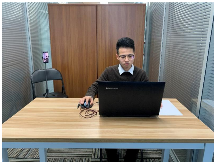
图一：电脑端正面视角

（4）考试开始前，考生需要先登录移动端“智考通”，用前置摄像头 360 度环绕拍摄考试环境，随后将移动设备固定在能够拍摄到考生全身（含侧面）、考试桌面、完整的考试设备（电脑屏幕和键盘等）、考生双手动作（考生行为）及考生周围环境的位置上继续拍摄考试全程（详见说明书中《智考通操作手册》《智考云在线考试规范》）。 请考生注意，视频拍摄角度不得存在盲区，不得无故中断视频录制，考试视频数据不得缺失，不得出现影响考务人员判断本场考试有效性等情况，否则将影响成绩的有效性，由考生自行承担后果。