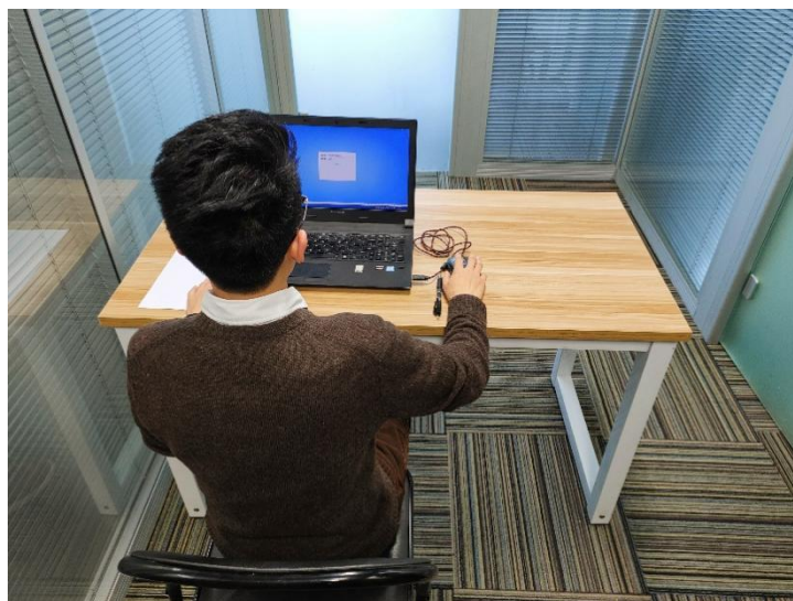
图二：电脑端背面视角