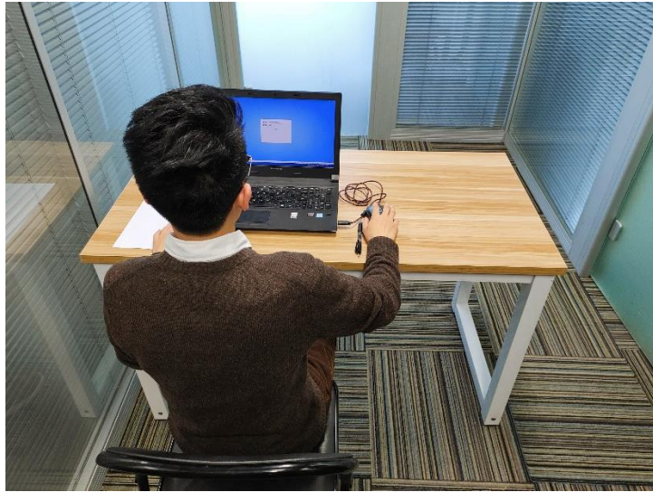
图二：电脑端背面视角