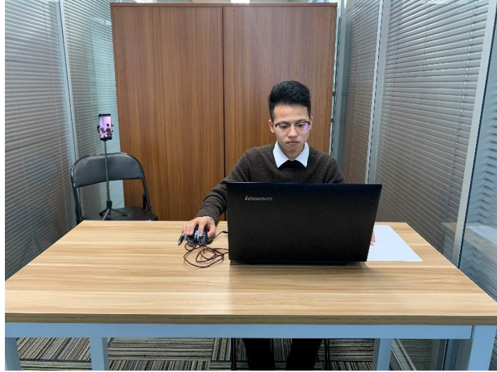
图一：电脑端正面视角